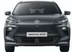
დაფარვის წინა ბურთის შორის 1554mm

აქტიური პარკინგის და რეჯენერაციული ბრუნვის სისტემები, დამატური ინფორმაციისთვის მიმართეთ დილერს