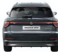
დაფარვის უკანა ბურთის შორის 1561mm

სრული სიმაღლე 1,621MM (SE) 1,633MM (TROPHY)