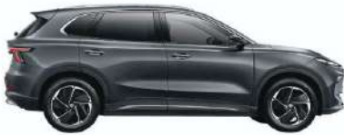
დაფარვის საბურავის შორის 2730mm